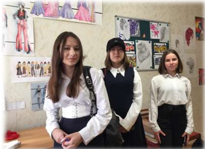
День открытых дверей