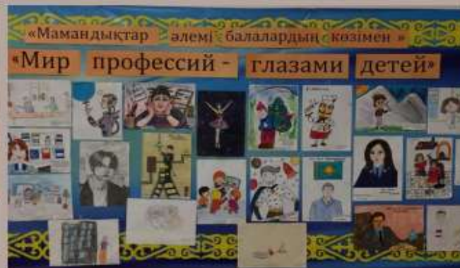
игры, тренинги, конкурсы