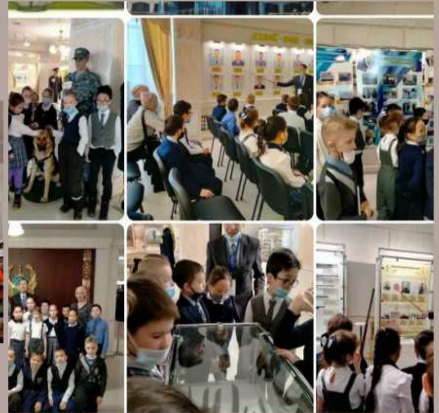
Музей МВД РК