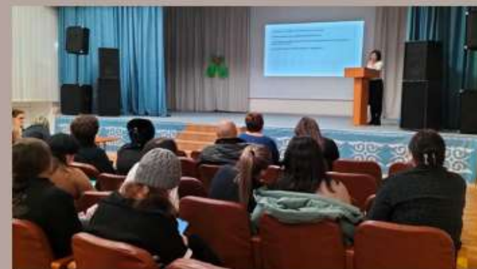
работа с родителями